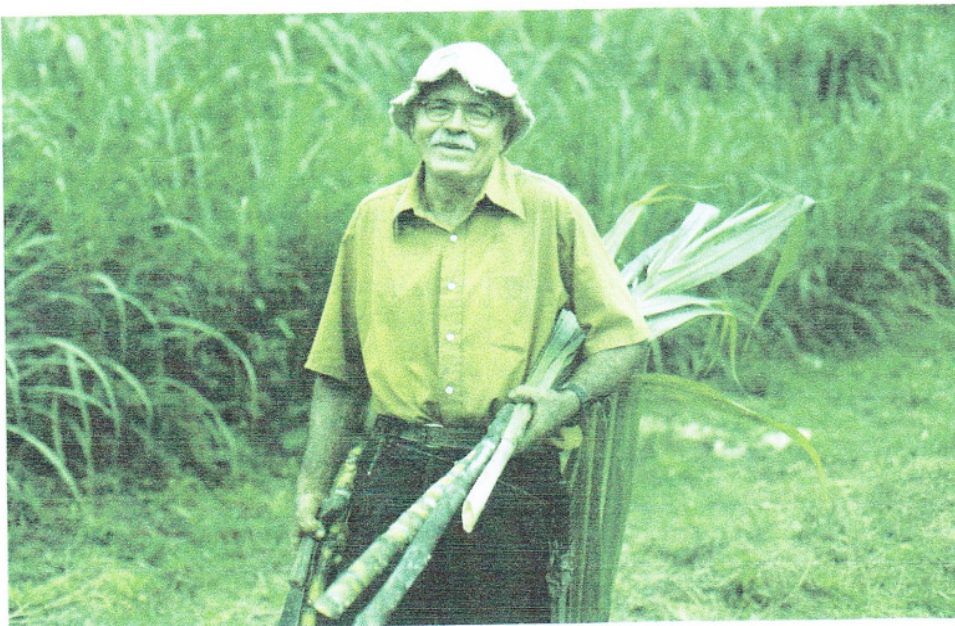
Dieser Zuckerrohrbauer auf Costa Rica verkauft über Max Havelaar.

Wenn man den anspruchsvollen Anbau der Zuckerrüben, die vertragliche Abhängigkeit von der Industrie, die fehlenden Pflanzenschutzmassnahmen im Bio-Anbau und das Bodenschädigungspotenzial betrachtet, so fragt man sich, was diese Kultur überhaupt im Biolandbau zu suchen hat. Zudem ist die Unkrautregulierung nur mittels Handarbeit zu schaffen (80–330 Stunden pro