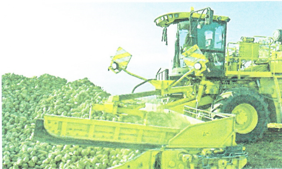
Mit diesem Bild wirbt die Schweizer Zucker AG auf www.zucker.ch .

Aber: Wäre eine Aufgabe der Zuckerrübenproduktion in der Schweiz überhaupt ein Unglück? Ist eine Förderung dieses An-